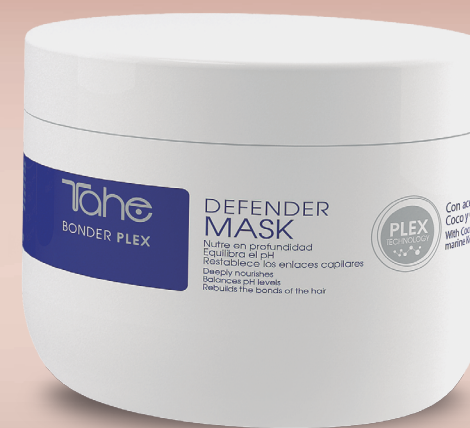
Defender mask 300 ml