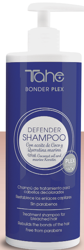
Defender shampoo 400 ml