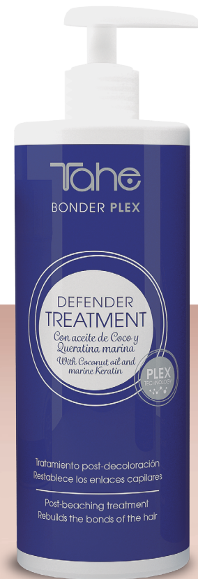
Defender treatment 400 ml