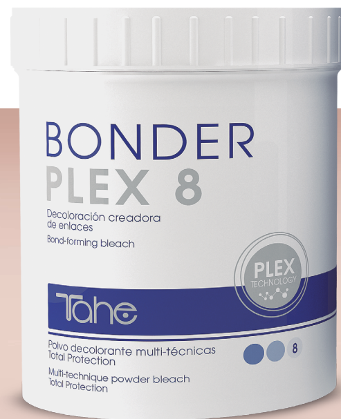
Bonder Plex 8 500 g